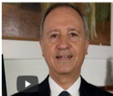
L'Ambasciatore Armando Varricchio

Berlino - L'Ambasciata d'Italia a Berlino ha organizzato una serata di presentazione della quarantacinquesima edizione del "Rossini Opera Festival". L'edizione del 2024, anno che vedrà la città di Pesaro quale Capitale italiana della cultura, propone un programma ricco di eventi nell'arco di 17 giorni, 4 in più del consueto, per offrire maggiori possibilità al pubblico di assistere agli spettacoli del fitto calendario. Sono cinque le produzioni operistiche in cartellone: due nuove, "Bianca" e "Falliero ed Ermione", e tre riprese, "L'equivoco stravagante", "Il barbiere di Siviglia" e "Il viaggio a Reims". Quest'ultima, opera simbolo del Festival, sarà proposta sia nella consueta versione eseguita dagli allievi dell'Accademia Rossiniana "Alberto Zedda", sia in concerto al termine del programma per celebrare il 40° anniversario della sua prima rappresentazione moderna a Pesaro nel 1984. Alla serata di presentazione del programma del Festival, ospitata dall'Ambasciatore Armando Varricchio, sono intervenuti Matteo Ricci, Sindaco del Comune di Pesaro, Daniele Vimini, Vice Sindaco e Presidente del Rossini Opera Festival, Ernesto Palacio, Intendente del Rossini Opera Festival e Cristian Della Chiara, Direttore Generale del Rossini Opera Festival. "Sono