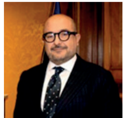
Gennaro Sangiuliano Ministro della cultura