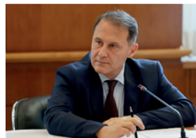
On. Edmondo Cirielli

Roma - Il Vice Ministro degli Affari Esteri e della Cooperazione Internazionale, on. Edmondo Cirielli, ha partecipato all'evento di apertura del Forum Mondiale dell'Alimentazione (World Food Forum) organizzato dalla FAO a Roma. L'evento, giunto alla sua terza edizione, si svolge dal 16 al 20 ottobre (in concomitanza con la Giornata Mondiale dell'Alimentazione) sotto il tema "La trasformazione dei sistemi agroalimentari accelera l'azione per il clima" e focus su azione dei giovani, innovazione, educazione e cultura. Nel suo intervento, il Vice Ministro Cirielli ha ricordato il nesso tra sicurezza alimentare e cambiamento climatico, problematica sempre più centrale nell'agenda politica internazionale e nel cui contesto l'Italia sta portando avanti una stretta collaborazione con la COP 28.