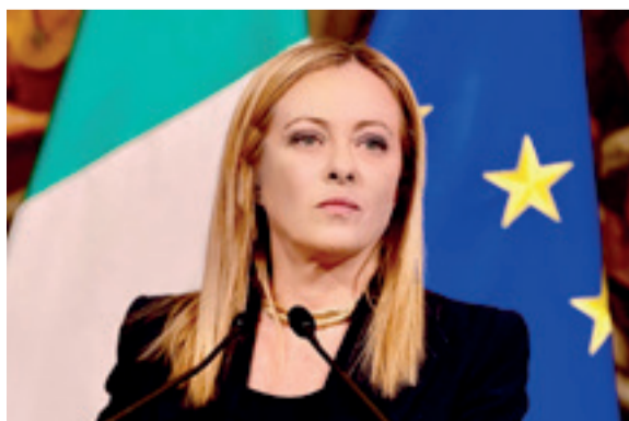
Giorgia Meloni, Presidente del Consiglio dei Ministri

Roma - "Dopo il parere positivo della Commissione europea, il Consiglio Europeo ha oggi approvato la revisione del PNRR italiano. Così in una nota il Presidente del Consiglio Giorgia Meloni che prosegue: "Un altro grande risultato del Governo che conferma la serietà e l'efficacia del lavoro svolto in questi mesi. Intendia-