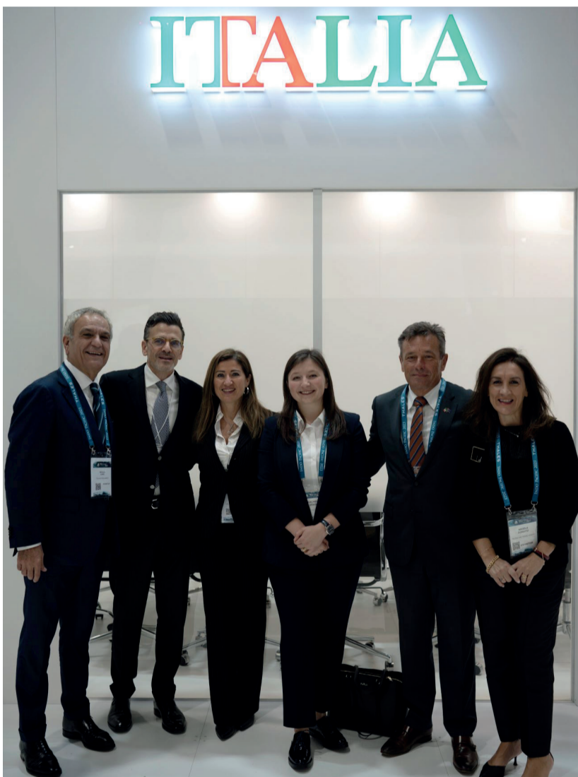
A sinistra: l'On. Nicola Carè in una foto ricordo con un gruppo di partecipanti all'evento.

partimento "politiche industriali e relazioni internazionali". Sono state avviate azioni di comunicazione a sostegno della presenza italiana e favorito il match-making tra i rappresentanti delle aziende italiane presenti e le delegazioni estere in visita, in collaborazione con l'Addetto militare italiano a Canberra. Per affrontare i rischi strategici attuali, si raccomanda un cambiamento nella struttura delle forze armate Australiane. Si enfatizza la necessità di un processo di acquisizione di capacità più efficiente e di bilanciare l'industria australiana con l'acquisizione tempestiva di attrezzature e tecnologie provenienti dall'estero." Così Nicola Carè, deputato del Pd eletto all'estero, componente della Commissione difesa e dell'assemblea parlamentare Nato.