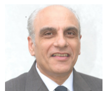
Michele Schiavone Segretario generale del CGIE

Roma, 28 gen. - Italiani di nuovo al voto il 29 marzo prossimo. Il Consiglio dei Ministri riunito nel tardo pomeriggio di ieri, infatti, ha convenuto sulla data del 29 marzo 2020 per l'indizione del referendum sulla legge costituzionale che taglia il numero dei parlamentari. Il referendum - chiesto da 71 senatori - dovrà essere indetto con un decreto del Presidente della Repubblica. La legge costituzionale che taglia il numero dei parlamentari - "Modifiche agli articoli 56, 57 e 59 della Costituzione in materia di riduzione del numero dei parlamentari" - è stata approvata dal parlamento l'anno scorso e pubblicata nella Gazzetta Ufficiale del 12