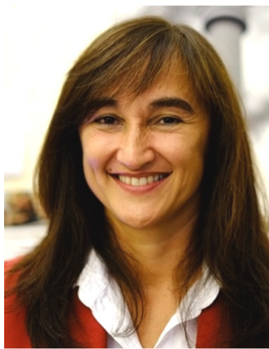
Sen. Laura Garavini

Governo salvaguardi contributi per la stampa italiana all'estero