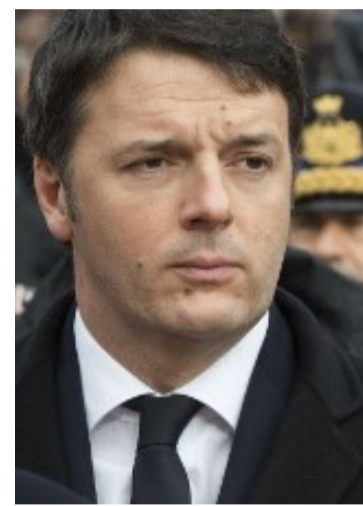
Sen. Matteo Renzi Fondatore di "Italia Viva"

Roma, 20 feb. - "Ci sono due esempi positivi nella pubblica amministrazione, la ricostruzione del ponte Morandi e l'expo a Milano. La nostra proposta è mettere i commissari nei cantieri più importanti di questo Paese". Così il leader di Italia Viva, Matteo Renzi, presentando il piano Italia Shock nel corso di una conferenza stampa al Senato, giovedì 20 febbraio, spiegando che il provvedimento è pronto. "Senza il rilancio delle infrastrutture e lo sbocco dei cantieri la crisi che probabilmente ci accingiamo a vivere sarà ancora più grave. È una proposta offerta al governo, il nostro obiettivo è dare una