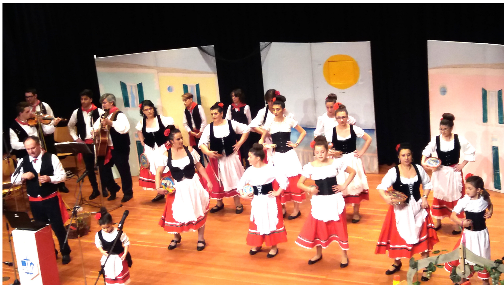
Il Gruppo folcloristico di Kaufbeuren "FOLK-ACLI" durante l'esibizione del musical "Focuammari".

Presidente del Circolo Acli di Kaufbeuren-Marktoberdorf e delle ACLI Baviera