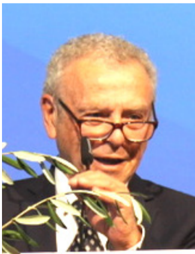
Massimo Medri Sindaco di Cervia