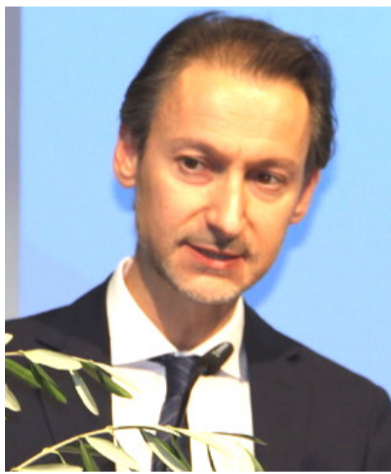
Massimo Darchini Console Generale d'Italia a Stoccarda