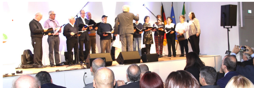
Il coro italiano della Missione Cattolica di Stoccarda.