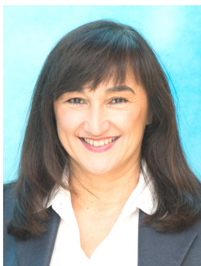
Sen. Laura Garavini