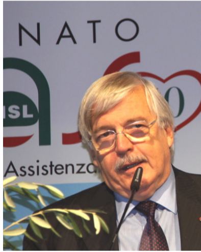
Sen. Claudio Micheloni