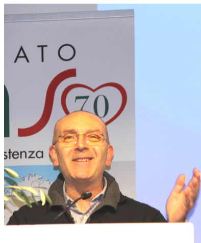
Sen. Vito Petrocelli