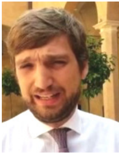
On. Massimo Ungaro