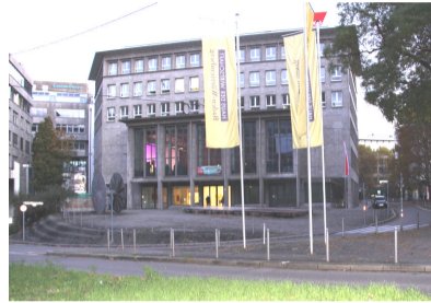
La sede del DGB a Stoccarda