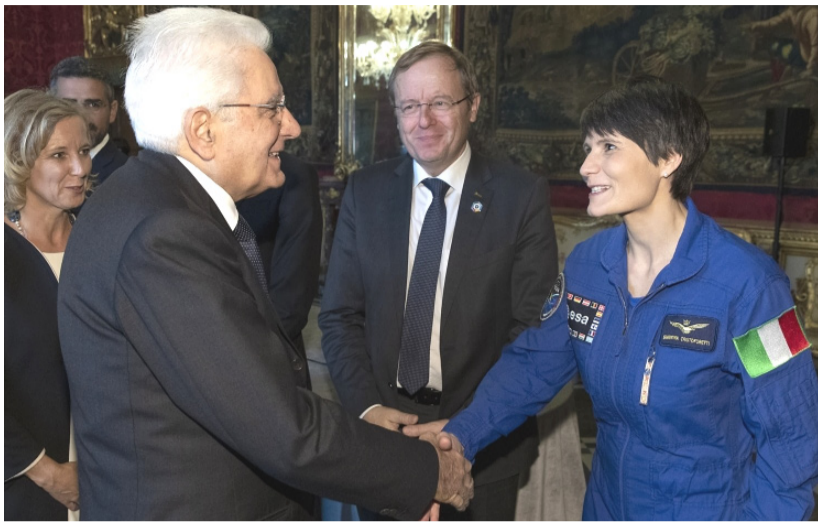
Il Presidente Sergio Mattarella con Samantha Cristoforetti e Johann-Dietrich Wörner, Direttore Generale dell'ESA, in occasione del collegamento con l'astronauta Luca Parmitano dalla Stazione Spaziale Internazionale.