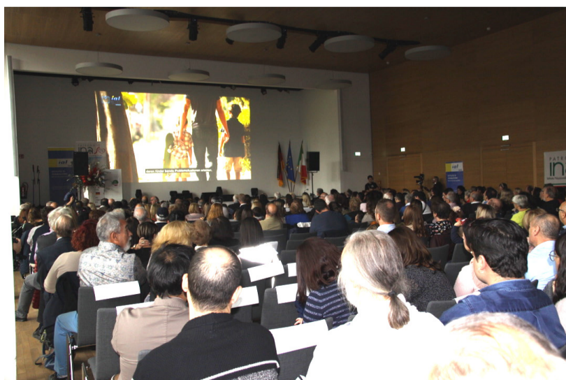
Proiezione video sull'emigrazione